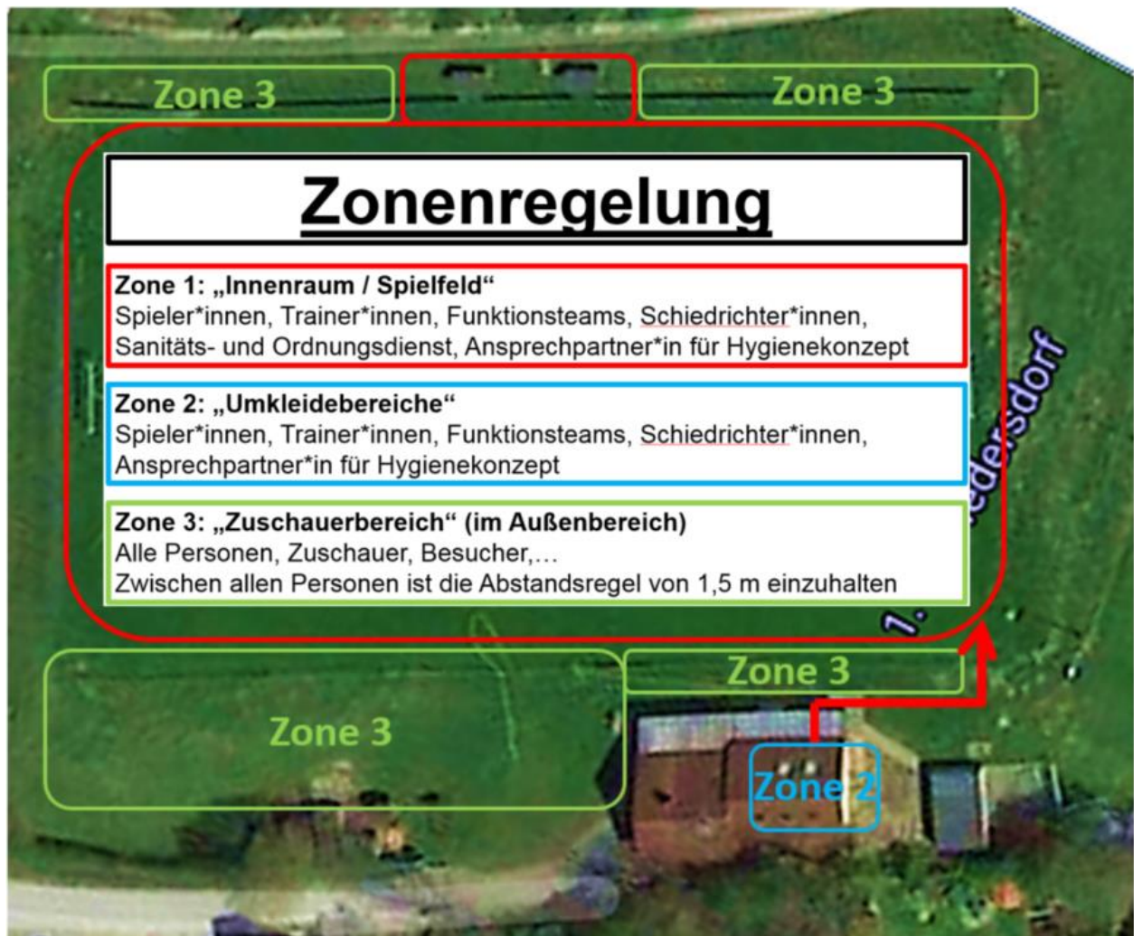
Zonierung Sportgelände

Folgende Bereiche der Sportstätte fallen nicht unter die genannten Zonen und sind separat zu betrachten und anhand der lokal gültigen behördlichen Verordnungen zu betreiben: